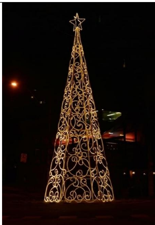
Modelo das estruturas – observadas as medidas para cada item.