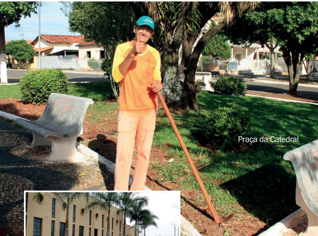
Praça da Catedral

A drenagem pluvial no Bairro Novo Oriente irá reduzir gastos com a manutenção das vias públicas, valorizar as propriedades e garantir o escoamento rápido das águas superficiais, gerando segurança e conforto para quem mora ou transita pelo bairro.