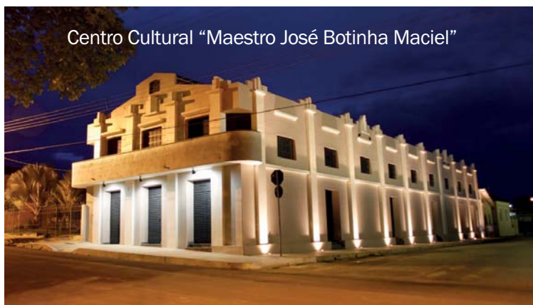
Centro Cultural “Maestro José Botinha Maciel”

A prefeitura investe também na restauração da Casa Grande. Para tanto, contratou, por meio de licitação, a Rede Cidade – Consultoria e Desenvolvimento Sustentável, para executar os serviços de elaboração de todos os projetos, bem como o cadastro para captação de recursos junto ao Fundo Estadual de Cultura, para que aquele espaço se torne útil para a comunidade.