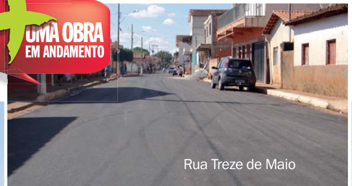
Rua Treze de Maio