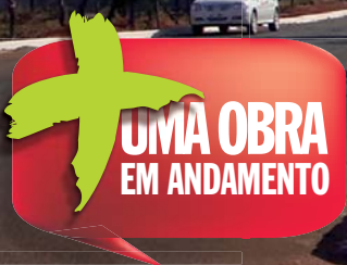
Av. Laerton Paulinelli