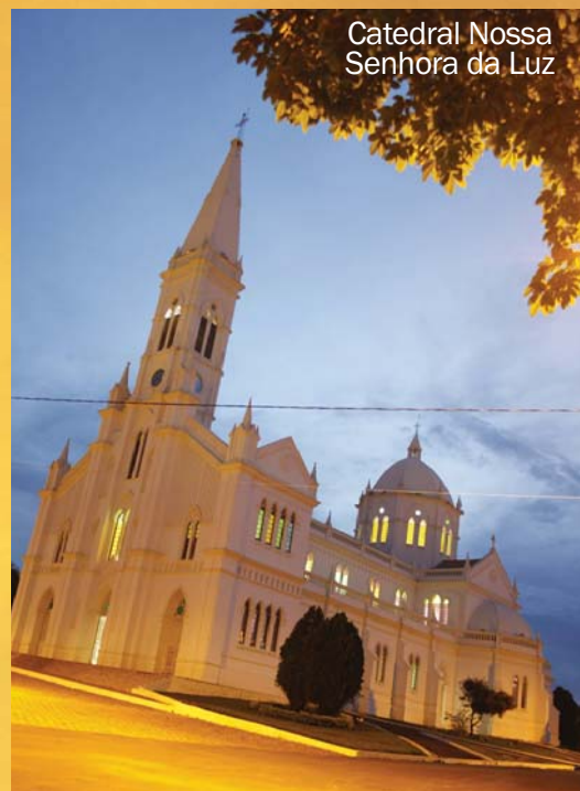
Catedral Nossa Senhora da Luz

Agora, é o momento de mostrarmos o que vem sendo realizado para o crescimento da nossa cidade – o seu crescimento, cidadão luzense! Neste final de ano, o nosso presente para você se resume em trabalho, trabalho e trabalho. E não vamos cansar de dizer: em uma cidade com nome de “luz”, gente é para brilhar!