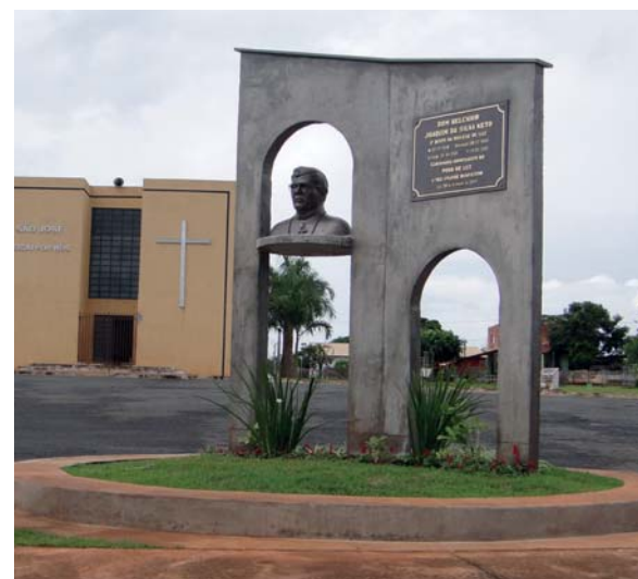
Monumento em homenagem a Dom Belchior, segundo bispo da Diocese de Luz

Valorização do trabalhador! O projeto “Alfabetizando os servidores públicos” aumenta a auto-estima, ensina a ler e a escrever, e dá lições de cidadania. Além disso, todos os profissionais do magistério tiveram reajuste salarial, em cumprimento ao Piso Nacional do Magistério.